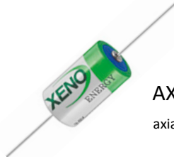
AX-Typ axiale Drähte