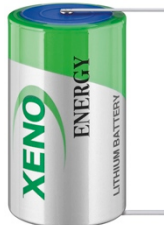
T1-Typ mit Lötfahne